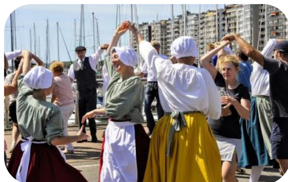
Ville de Blankenberge

Blankenberge : Paravangfeesten - Fêtes du Paravent , brocante, démonstrations d'artisanat, jeux populaires, danses folkloriques, chants de marins. Accès libre, 10h-18h. 📍 : www.visit-blankenberge.be