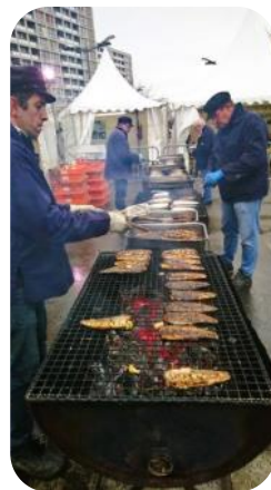
Ass. Pêche Animation

Fête du hareng, l'fête à tit Jean , "À chacun sin pin et s'n'hérin", l'arrivée du hareng côtier est toujours fêtée, grâce à l'association Pêche Animation. Dégustation vente de hareng sous toutes ses formes, dans une ambiance musicale locale, présence des géants et des associations locales... Expositions, démonstrations, animations sont au programme. Accès libre, quai Gambetta, 10h-19h.