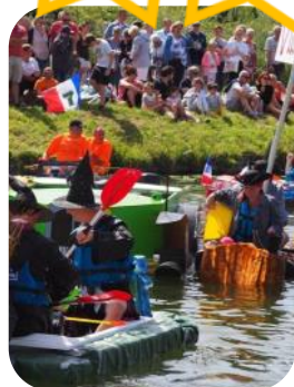
Cercle aviron du Calaisis