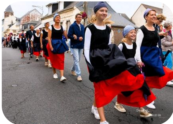
Ville de Cayeux/M

Fête de la mer , en matinée, messe, procession jusqu'à la plage et bénédiction à Cayeux. L'après-midi, la fête se poursuit au Hourdel, avec procession du calvaire jusqu'à la chapelle, bénédiction des bateaux de pêche, balades en bateaux et d'une soirée moules-frites musicale. Accès libre.