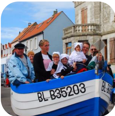
OT Terre des 2 Caps

Fête du flobart , Wissant célèbre la pêche traditionnelle et le bateau d'échouage symbole du littoral boulonnais : chants de marins, dégustation de produits de la mer, artisanat maritime, stands associatifs, expositions, défilé de flobarts dans les rues du village. Accès libre, place de la Mairie et place du Marché.