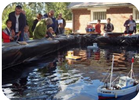
Musée du touage

Bellicourt (02) : Immersion dans le monde fluvial , autour de l'exposition « La flottille de Didier », un weekend d'animations au musée du touage, avec initiation au pilotage de maquettes radiocommandées et évocation de l'arrivée du toueur Ampère 1 sur le site du musée. Accès payant.