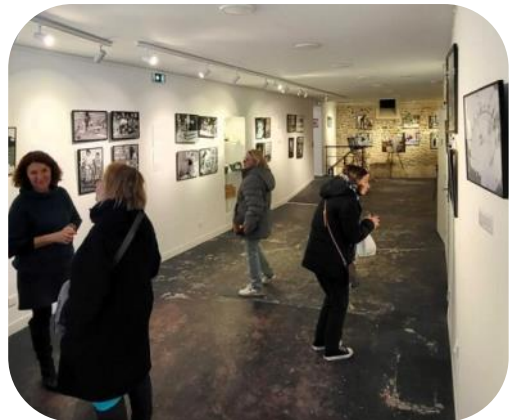
Ville de Le Crotoy

Exposition – Local à chalut & Galerie le Saint-Michel A l'occasion des Journées européennes du patrimoine, cette exposition de cartes postales anciennes, photographies et documents permet de mieux connaître le passé maritime du Crotoy. Accès libre, 10h-18h.